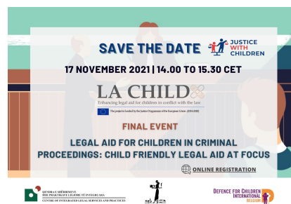
Table ronde : Faire de l'aide juridique adaptée aux enfants une réalité

Nous aurons la chance de présenter les résultats et matériaux développés lors du projet LA Child à l'occasion du World Congress on Justice with Children .