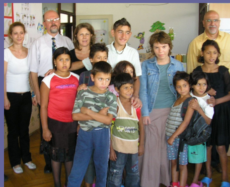
DEI Macédoine: Septembre 2006 Programme d'éducation pour enfants des rues