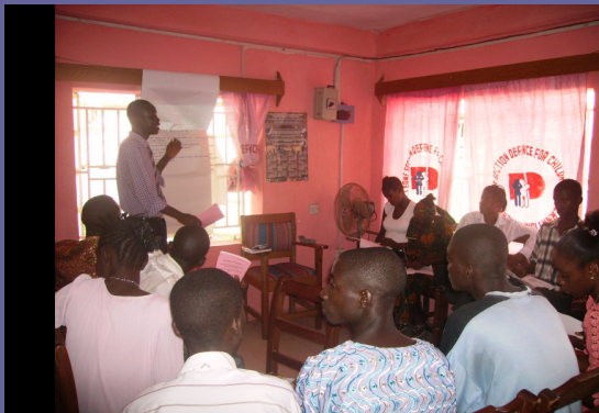
DEI Sierra Leone: Novembre 2006 Formation sur les droits des enfants pour les jeunes