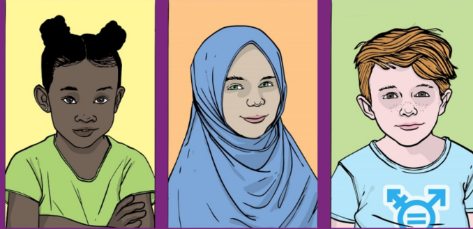
Illustration issue du projet BRIDGE - Voir l'exposition en ligne