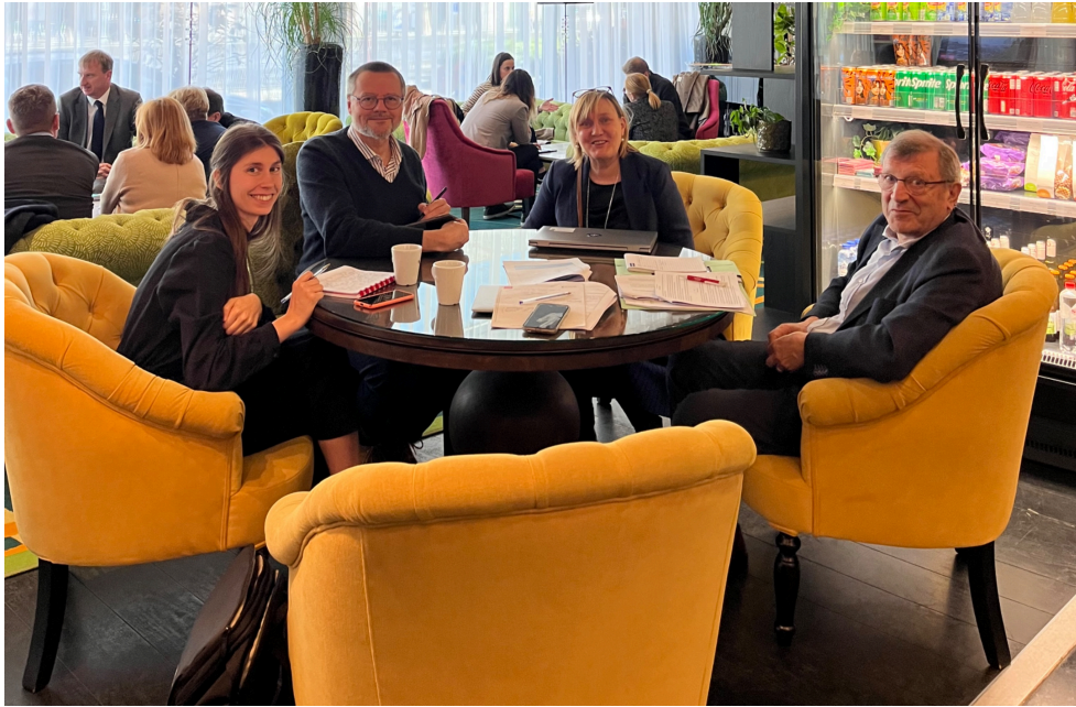
Table-ronde : les droits des enfants dans les procédures pénales

Ces 18 et 19 mars 2025, des professionnel·les européens se sont réunis pour discuter de la mise en œuvre de la directive européenne 2016/800, qui vise à garantir les droits des enfants dans les procédures pénales.